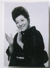
テレビでご活躍の頃

フィニッシングスクールインフィニまで 福岡市中央区渡辺通1・1・2 ホテルニューオータニ博多五階 電話(092) 711・7611